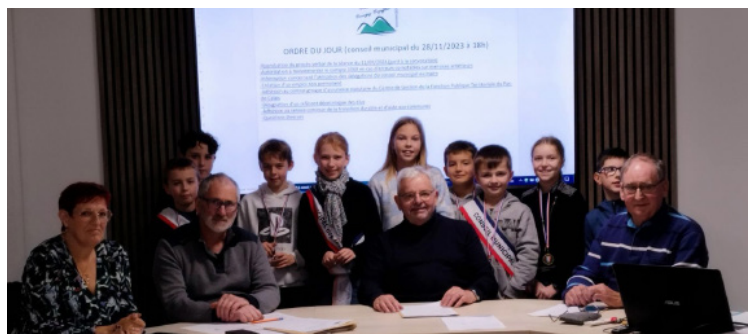
Le Conseil Municipal des Jeunes était présent lors du Conseil Municipal

- D'adhérer au service commun de la transition durable et d'aide aux communes pour une durée de trois ans à compter de la signature de la convention ; - D'autoriser le Maire à signer la convention cadre « Service Commun de la transition durable et d'aide aux communes » avec la CALL pour la mise en œuvre du service sur la commune.